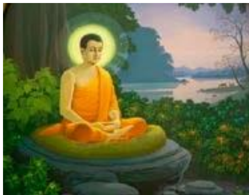
Будда (просветленный) (563-483 до н.э.)

У истоков Буддизма стоит легендарная личность Будды - Сидхартха Гаутамы, принца племени шакьев